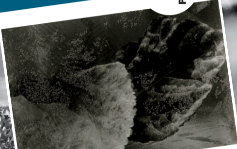
Pilar Pequeño - "Hojas de chopo" - 1995